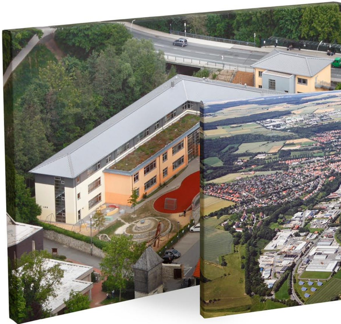
3D – Keilrahmen *4cm*