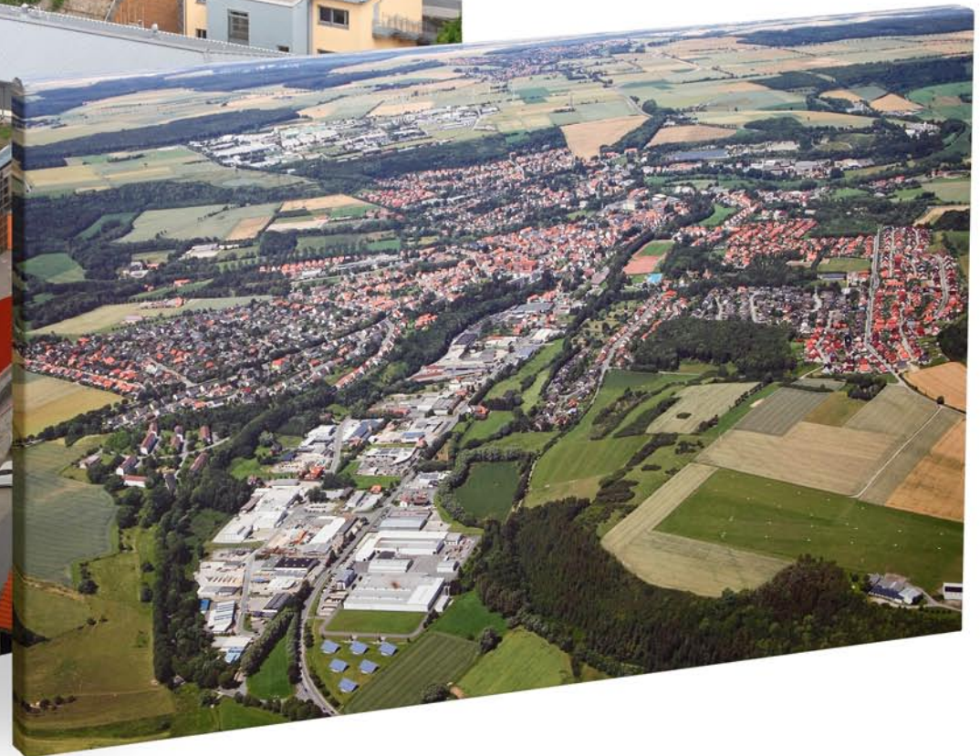
Standard – Keilrahmen *2cm*